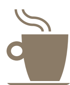
Café expresso Espresso