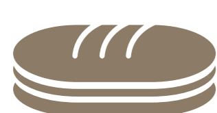
•Sandwich au choix Of your choice