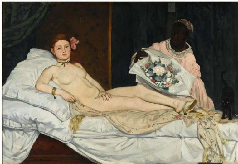
Édouard Manet Olympia , 1863

Offert à l'État par souscription publique sur l'initiative de Claude Monet Huile Huile sur toile